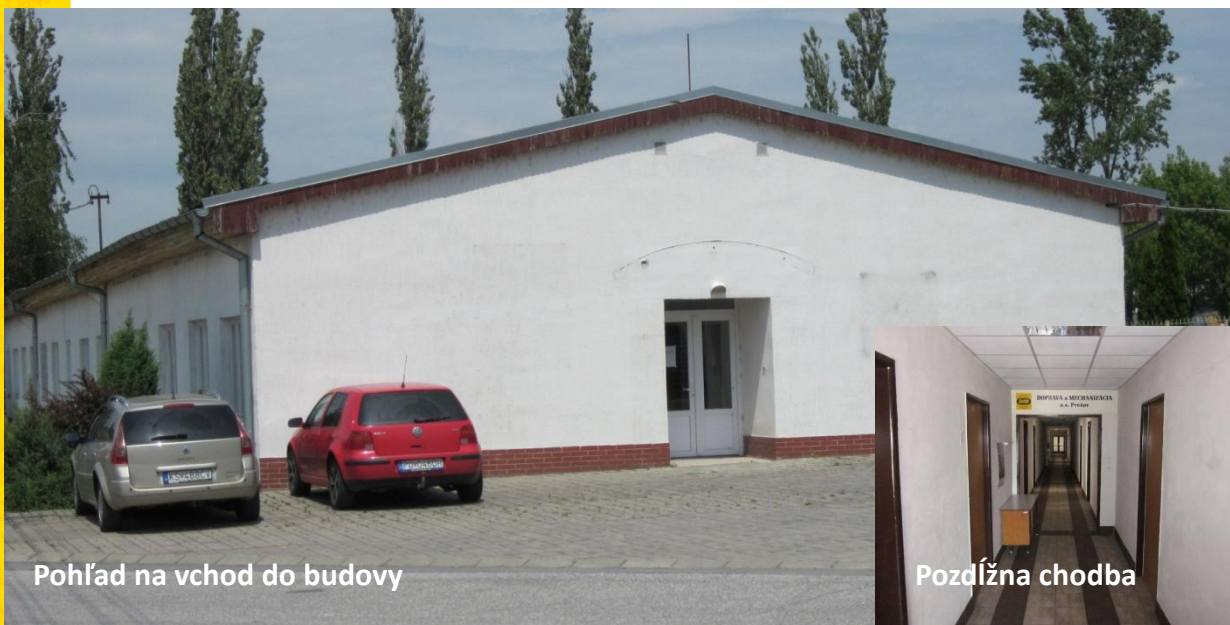
Pohľad na vchod do budovy

Ponúkame prenájom kancelárskych priestorov v priemyselnej časti mesta s výborným prístupom pre osobné ako aj pre nákladné vozidlá. Parkovisko pre osobné vozidlá je priamo pri budove. Je možnosť dohodnúť sa aj na parkovaní nákladných vozidiel a kamiónov taktiež v bezprostrednej blízkosti budovy. K dispozícii sú aj skladovacie priestory mimo administratívnu budovu. V rámci areálu sa nachádza servis nákladných vozidiel, autoumyvárka, STK.