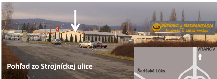
Pohľad zo Strojníckej ulice